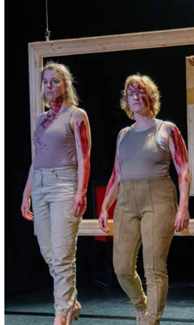
#WARRIOR QUEENS [12+]