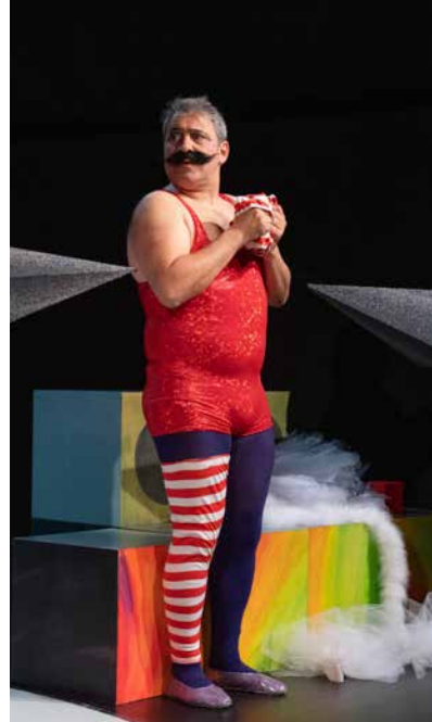
DER FABELHAFTE DIE [9+]